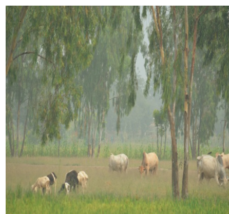
Dallol Maouri ( Mr. Ali Laouel, October 2017)

Desde 1975 se han observado cambios significativos en el uso del suelo. Las superficies cultivadas y la ganadería aumentan para satisfacer las crecientes necesidades alimentarias (el país se caracteriza por tener una de las mayores tasas de crecimiento demográfico, en torno al 3,9% (según el Censo General de Población de 2012)). Estos factores antropogénicos, junto con los factores