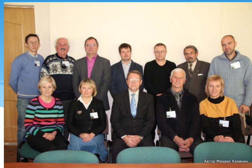
Автор Михаил Калинин

25 октября 2014 г. в г. Гродно было проведено учредительное собрание по созданию международной бассейновой ассоциации хранителей реки Неман, которая имеет название «Ассоциация хранителей рек «ЭКО-КРОНЕС» . Учредителями стали от Беларуси – 5 организаций, от Литвы – 2, от Молдовы - 1, от - России – 2.. Утвержден Устав, выбран Совет Ассоциации, контрольно-ревизионная комиссия. Материалы по учредительному собранию частично размещены на Фейсбуке, сайте «Еco-TIRAS», а также на