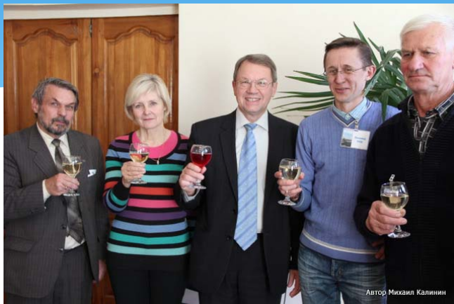
Автор Михаил Калинин