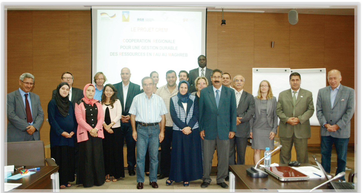
Rencontre des Points Focaux du projet CREM à Rabat, Septembre 2014

Ce projet a pour objectif l'échange de bonnes pratiques dans le cadre d'une gestion durable des ressources en eau, mais aussi l'amélioration de la gestion des eaux souterraines.